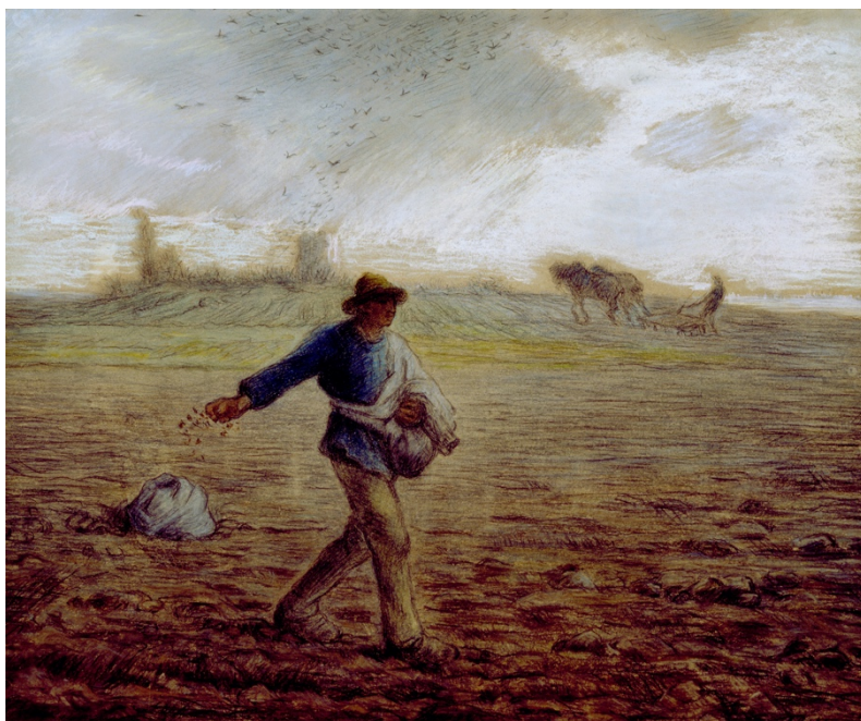
Сеячът - Жан-Франсоа Миле