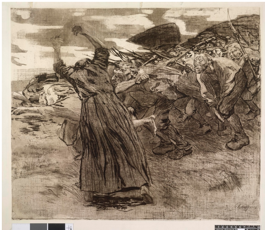
Losbruch (Избухване) - Кете Колвиц