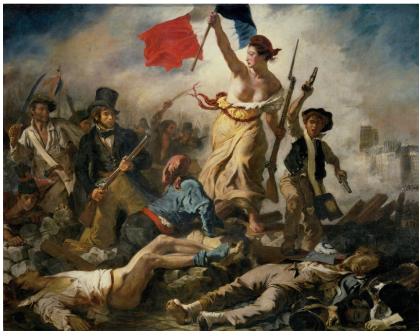
Свободата води народа – Йожен Дьолакром