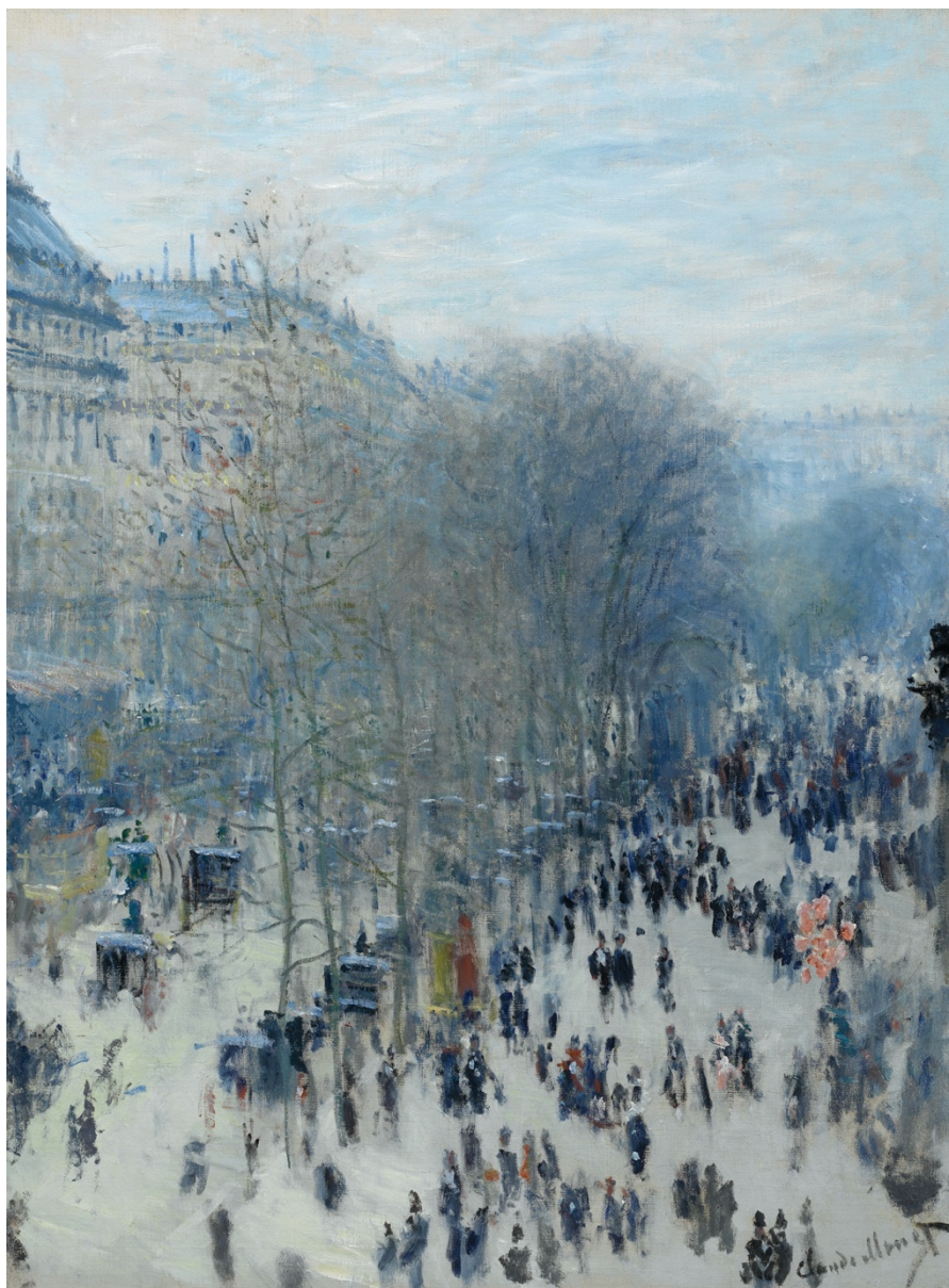
Булевард де Капуцини - Клод Моне

След това този раздел преминава към разглеждане на други социално значими теми, като например в " Гладачите " (1884) на Едгар Дега и " Абсент " (Absinthe) (1873). Има ли значение, че намираме удоволствие в тези произведения? Тези творби на гладачи и пиячи оказват голямо влияние върху Пикасо, който рисува поредица от гладещи жени, в началото на века, концентрирайки се върху скритата страна на Париж. Политическите симпатии на тези картини могат да бъдат използвани за въвеждане на политическата тема в други по-експериментални творби на Пикасо, като