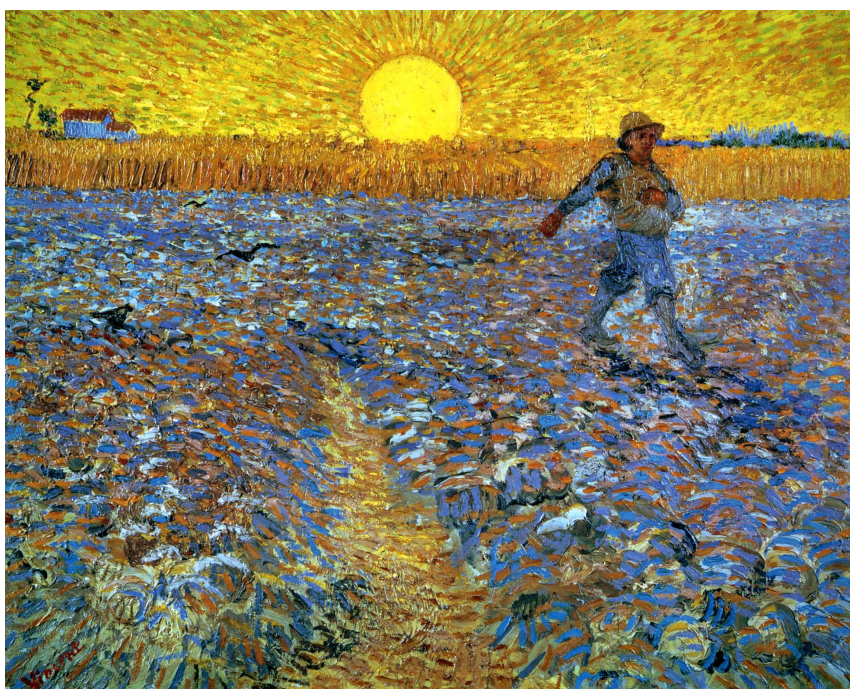
Сеячът със залязващото слънце- Винсент Ван Гог