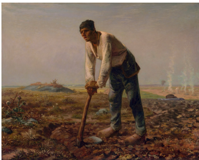
Човекът с мотиката- Жан-Франсоа Миле