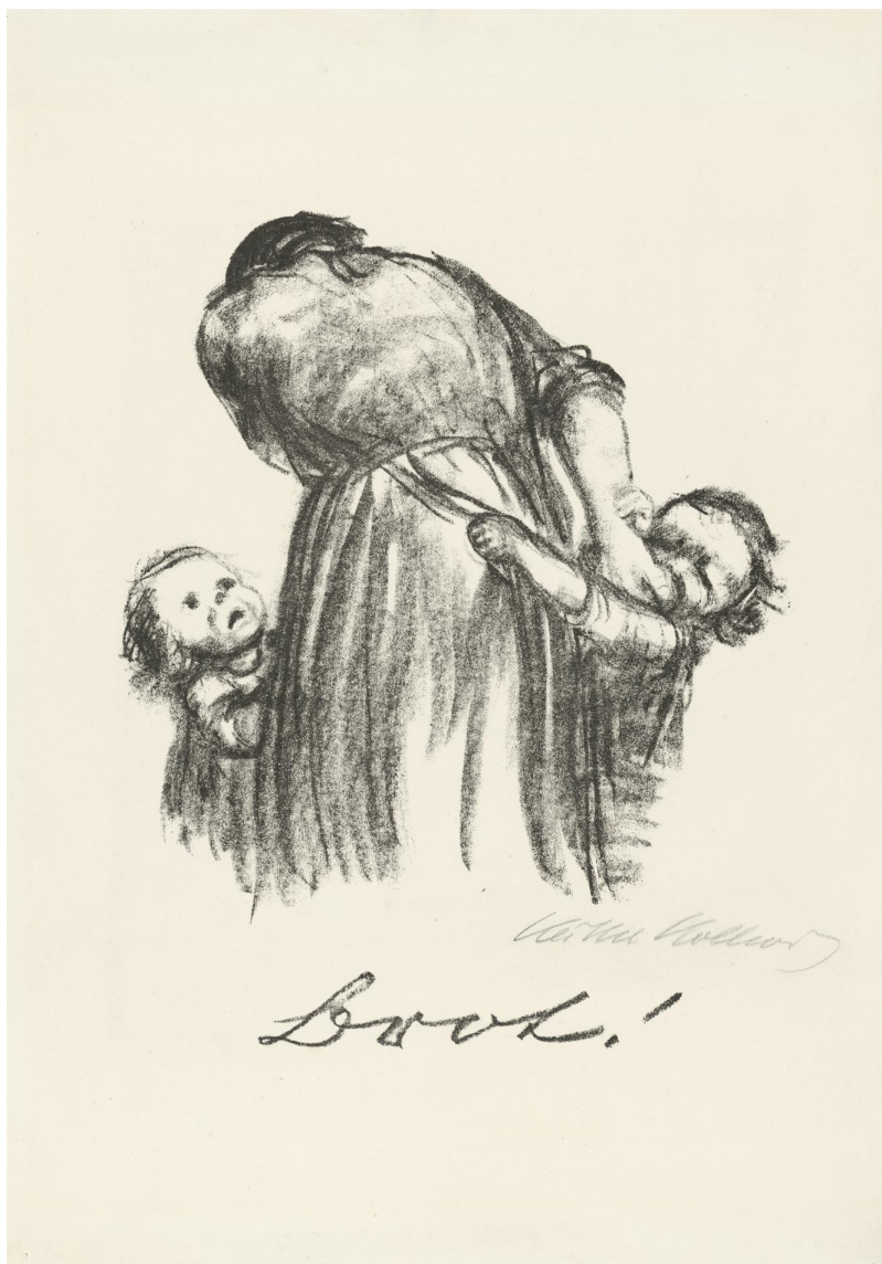
Хляб! - Кете Колвиц