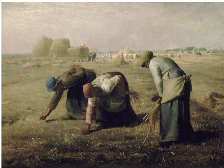
Събирачите- Жан-Франсоа Миле

платното. Те са затворени в композицията, тъй както са затворени в бедността си.