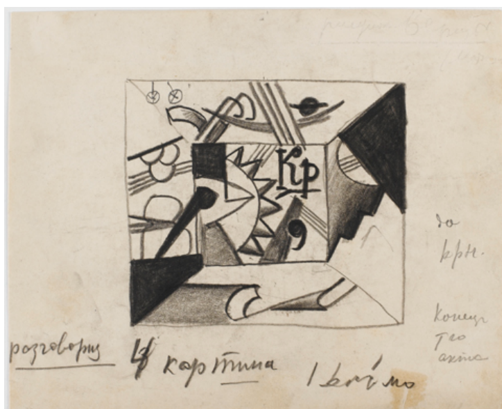
Победа над слънцето – Казимир Малевич

селските райони" от 1918 г. тук се сравняват с примери за боядисани влакове, стени и други форми на болшевишка пропаганда. За да постави Малевич в контекста на художествения активизъм, тук се разглеждат и политически плакати на неговия колега Ел Лисицки, както и архитектурният проект на Владимир Татлин "Паметник на Третия интернационал" (1919–20) – включително изображения на него, които се показват по улиците на Ленинград.