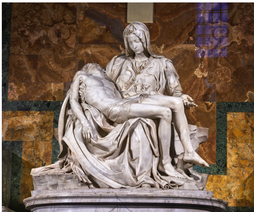
Микеланджело - Пиета