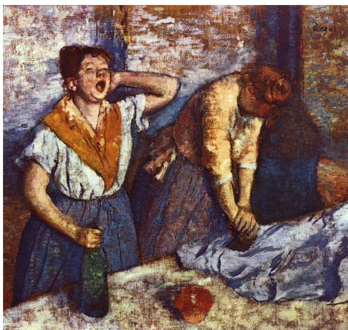
Гладачите –Илер Жермен Едгар Дега

картината му Младите дами от Авиньон (1907) и неговия кубистичен колаж Чаша и бутилка Suze (1912). Тези произведения на изкуството се разглеждат като критика на колониалистките бруталности в Централна Африка и анархистки протест срещу Балканската война, въпреки че днес нашият исторически контекст ни вдъхновява да критикуваме присъщия расизъм и сексизъм в отношението на Пикасо. Въпросите за историческата дистанция, авторството и публиката са важни тук, тъй като се стремим да разгадаем въпросите за ангажираността на Пикасо и нашите собствени такива. Този подраздел завършва с обсъждане на сложната политическа иконография на "Герника" на Пикасо (1937) и продължаващото присвояване на традиционни пози като "Пиета" на Микеланджело (1498–9), подобно на това, което видяхме по-рано около Марат на Давид.