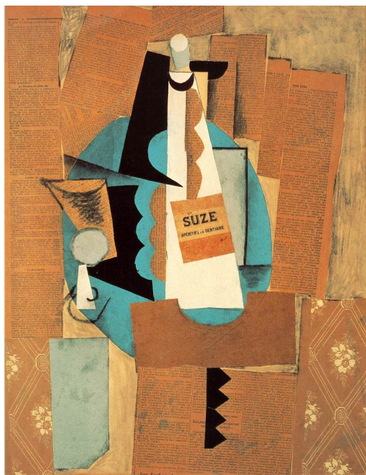
Чаша и бутилка Suze – Пабло Пикасо