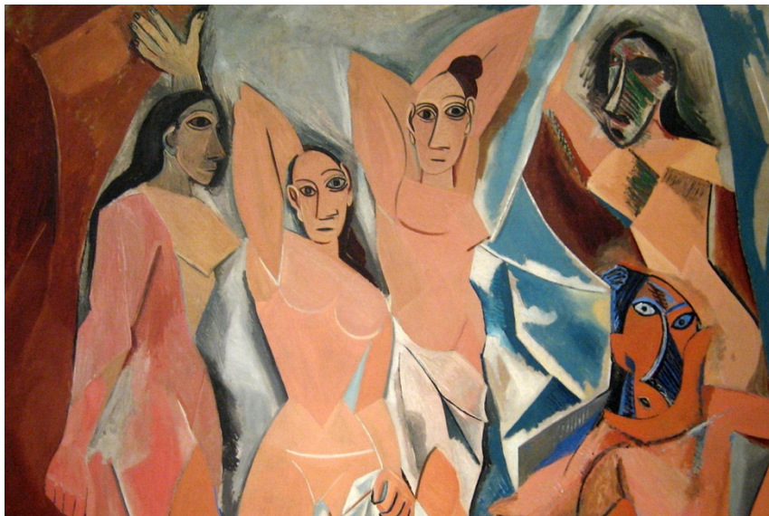
Младите дами от Авиньон – Пабло Пикасо