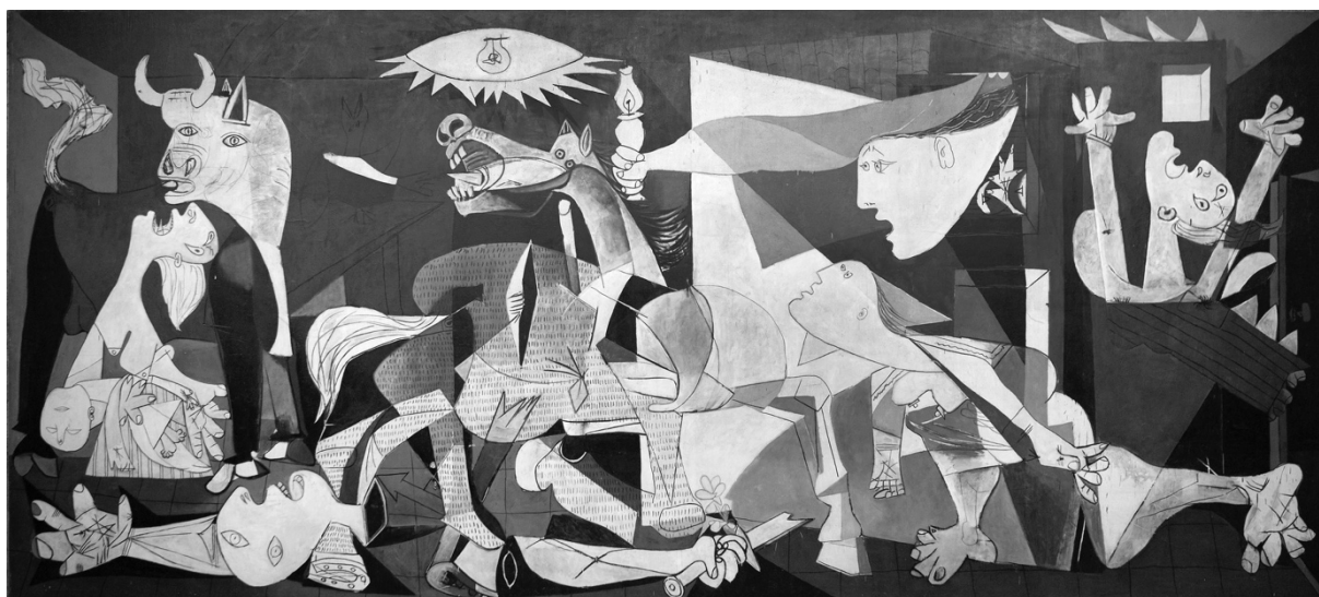
Герника – Пабло Пикасо