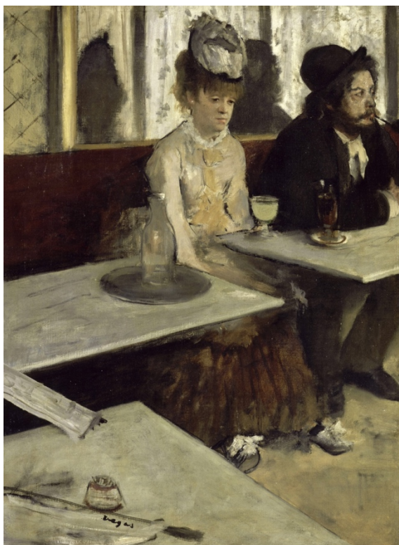
Абсент – Едгар Дега