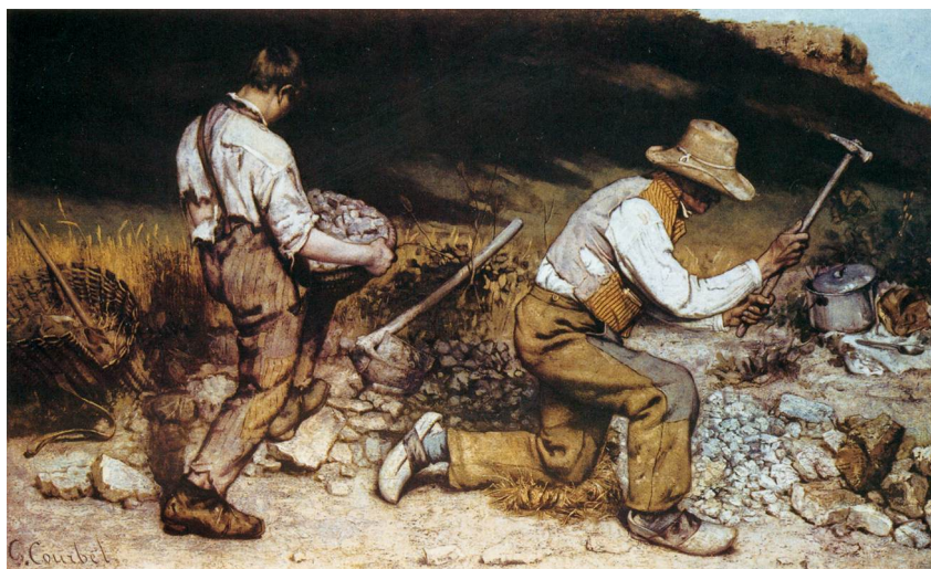
Разбивачите на камъни – Гюстав Курбе